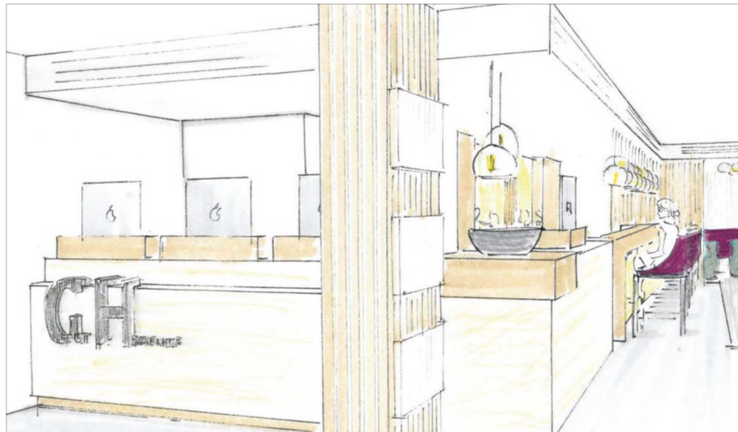
Eingang und Empfang